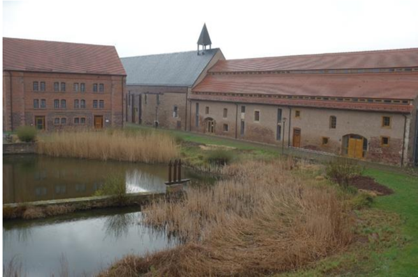
Gesamtansicht auf das Kloster Helfta bei Eisleben