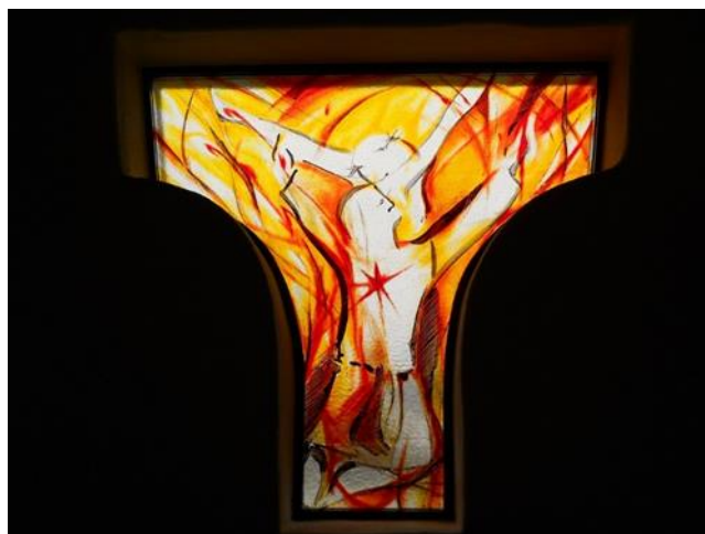
Franziskus begegnet dem Auferstandenen – Fenster in der Einsiedelei des Klosters Armstorf