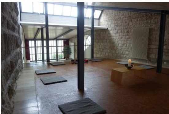
Meditationsraum im Südturm von Schloss Hirschberg